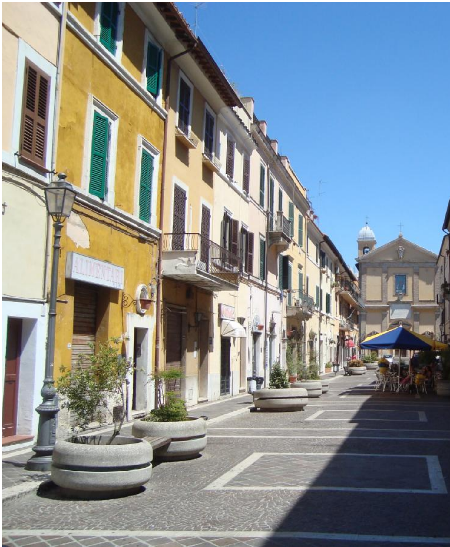
Lidh Duomo me sheshin e luaneve. Ndodhet ne qender te Monterotondos dhe eshte e pasur me dyqane te ndryshem: gjenden disa kafenera, dyqane veshje, parukeri, nje dyqan ushqimor, nje dyqan peshku e nje dyqan mishi.