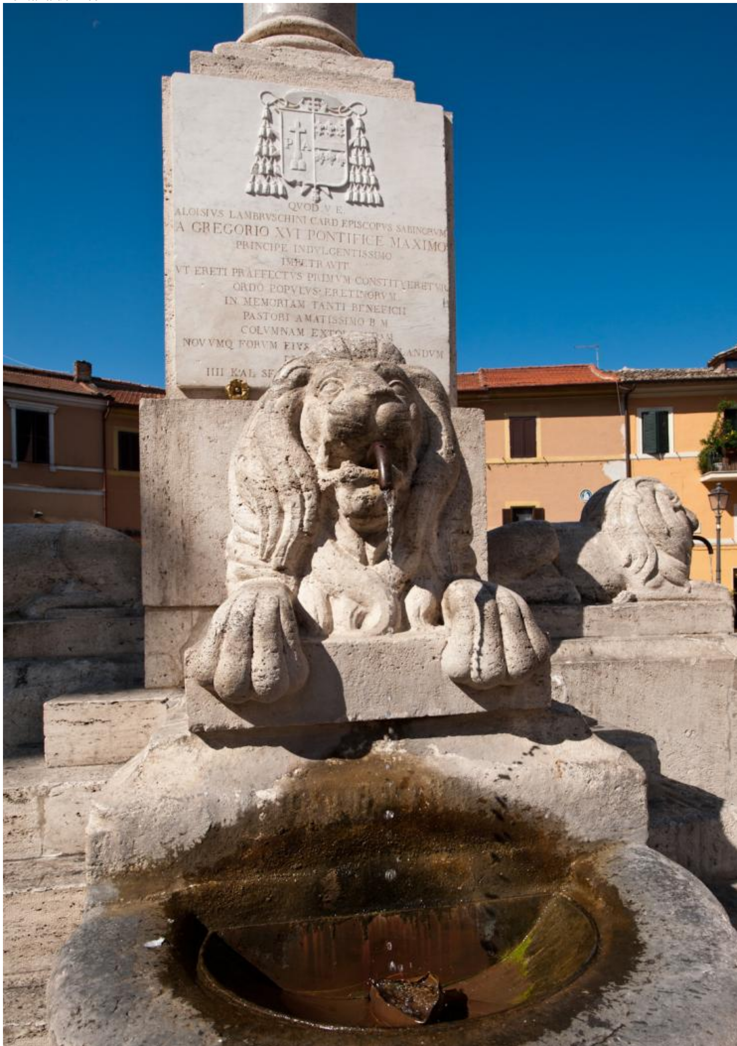
Fontana dei Leoni