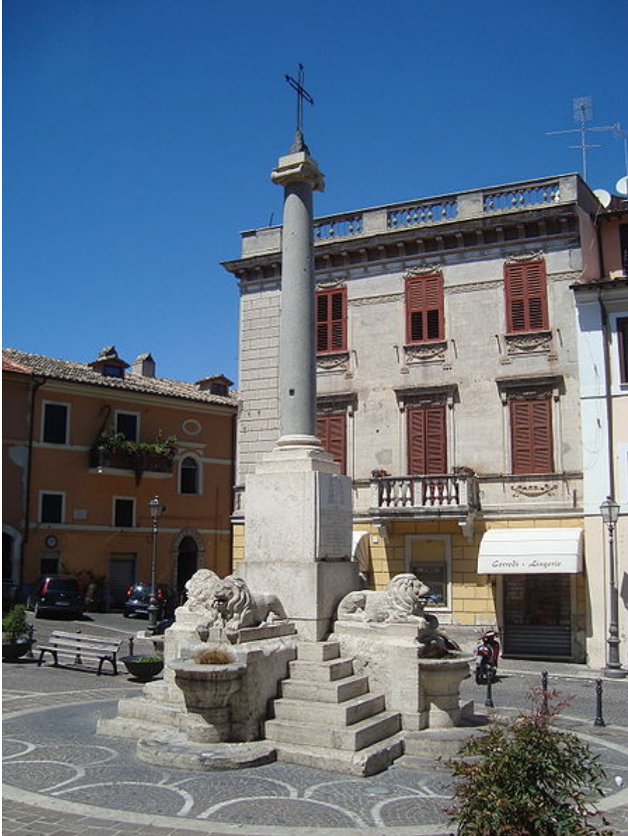
Piazza dei Leoni ndodhet ne pjesen