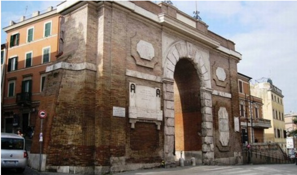
Ndertuar nga arkitekti Frontoni ne

v e qe paraqesin simbolin e familjes Grillo. Ne pallat jane te pranishme edhe stema te papeve, te famijes Medici e Orsini. Sallat e brendshme jane dekoruar me afreske te periudhes se Rilindjes. Oborri i brendshem quhet “oborri i pusit”, sepse ne mes gjendet nje pus i ndertuar ne shekullin XVI nga nje artist roman. Pas termetit te Avezzano ne 1915 u rindertua. Nga viti 1890 pallati eshte qender e zyrave administrative te qytetit.